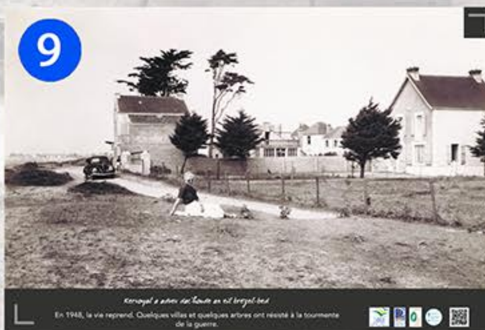
9 Kervoyal à son retour en 1948 En 1948, la vie reprend. Quelques villes et quelques années ont résisté à la tourmente de la guerre.