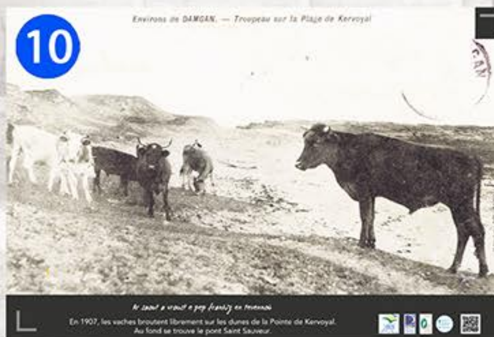
10 Environ de DAMGAN. - Troupeau sur la Plage de Kervoyal En 1907, les vaches broutent librement sur les dunes de la Pointe de Kervoyal. Au fond se trouve le port Saint Sauveur.