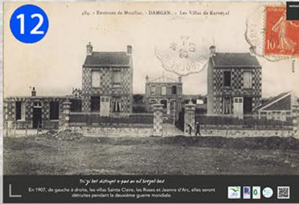
12 48. - Environ de Muzillac. - DAMGAN. - Les Villas de Kervoyal En 1907, de gauche à droite, les villas Sainte Claire, les Roses et Jeanne d'Arc, elles seront détruites pendant la deuxième guerre mondiale.