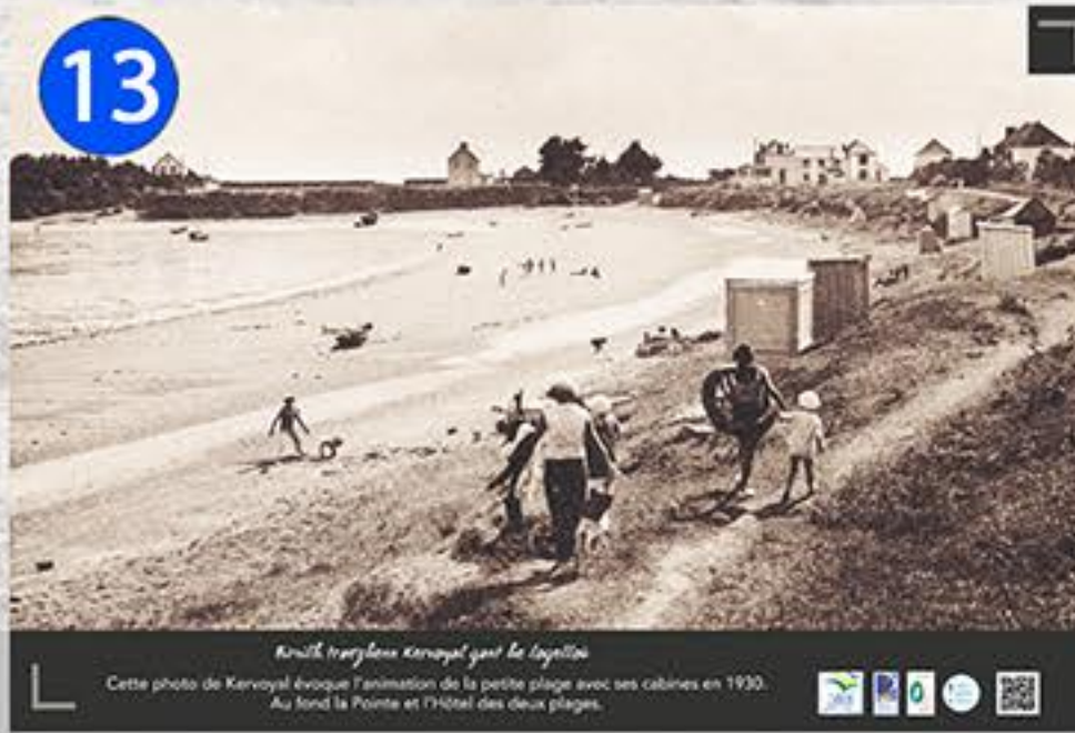
13 Kerfeuret organise Kervoyal pour la plage Cette photo de Kervoyal évoque l'animation de la petite plage avec ses cabines en 1930. Au fond la Pointe et l'hôtel des deux plages.