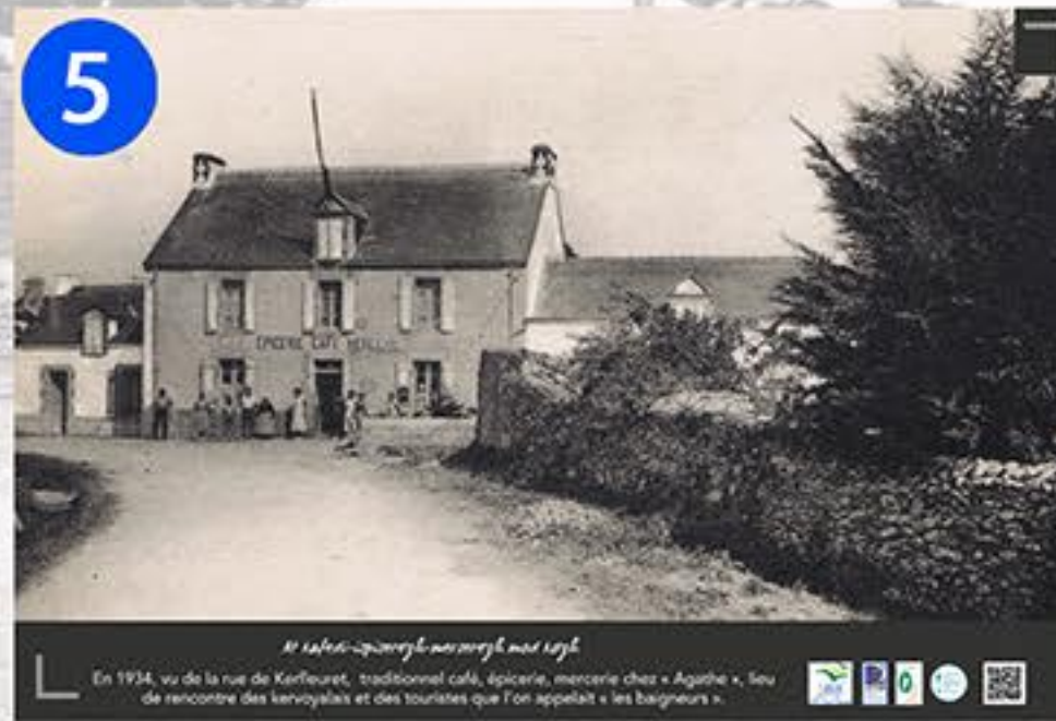
5 Le café-épicerie en 1934 En 1934, vu de la rue de Kerfeuret, traditionnel café, épicerie, mercerie chez « Agathe », lieu de rencontre des kervoyais et des touristes que l'on appelait « les baigneurs ».