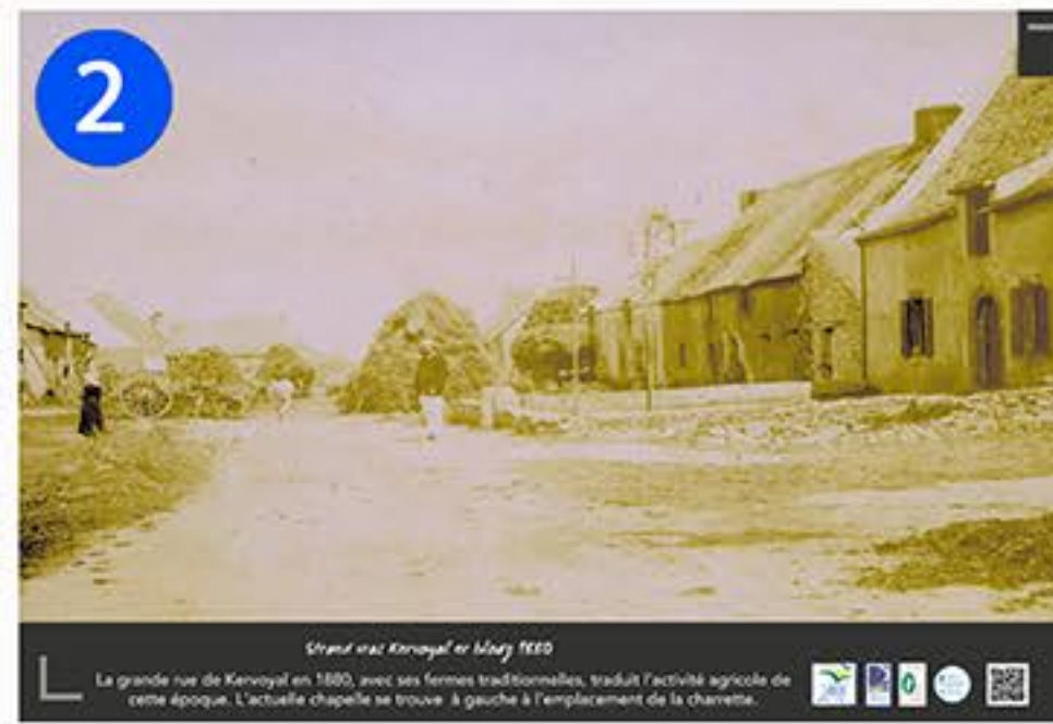
2 Strada vas Kervoyal en 1880 La grande rue de Kervoyal en 1880, avec ses fermes traditionnelles, traduit l'activité agricole de cette époque. L'actuelle chapelle se trouve à gauche et l'emplacement de la charrette.