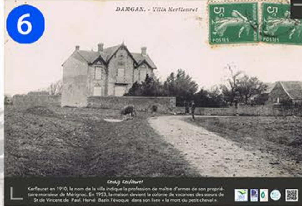
6 DAMGAN. - Villa Kerfeuret Kerfeuret en 1910, le nom de la villa indique la profession de maître d'armes de son propriétaire monsieur de Mérignac. En 1953, la maison devient la colonie de vacances des sœurs de St de Vincent de Paul. Hervé Bath l'évoque dans son livre « la mort du petit cheval ».