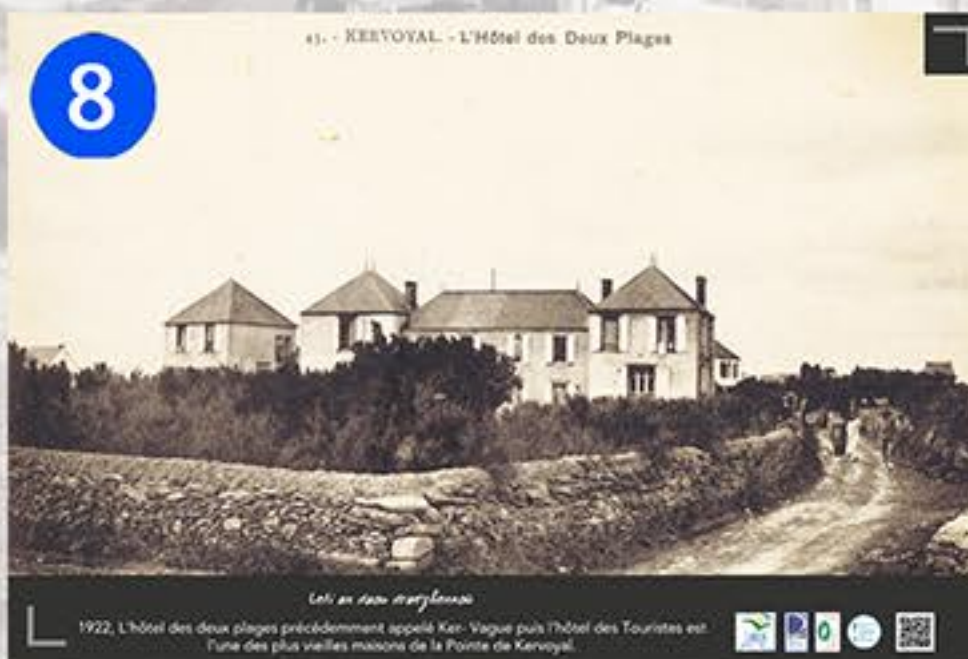
8 43. - KERVOTAL - L'Hôtel des Deux Plages L'hôtel des deux plages précédemment appelé Ker. Vagues puis l'hôtel des Touristes est l'une des plus vieilles maisons de la Pointe de Kervoyal.