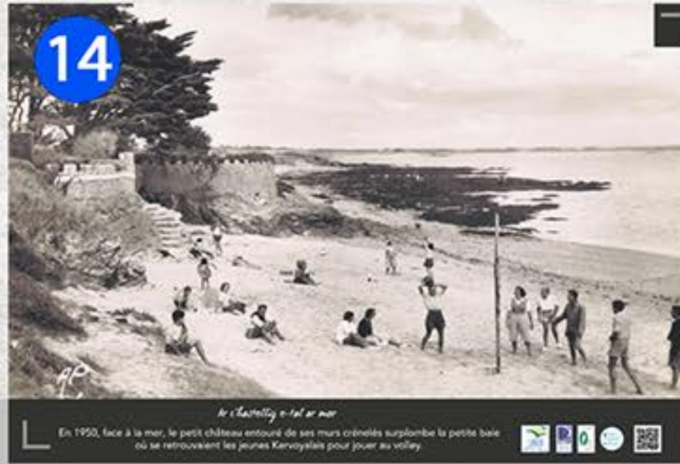
14 Le volley-ball au bord de la mer En 1950, face à la mer, le petit château entouré de ses murs crénelés surplombe la petite baie où se retrouvaient les jeunes Kervoyais pour jouer au volley.

Pour en savoir plus, retrouvez toute l'histoire de Kervoyal sur la page: http://damganhistoire.fr/index.php/kervoyal/