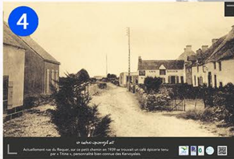
4 Le café-épicerie en 1939 Actuellement rue du Raquer, sur ce petit chemin en 1939 se trouvait un café-épicerie tenu par « Taine », personnalité bien connue des Kervoyais.