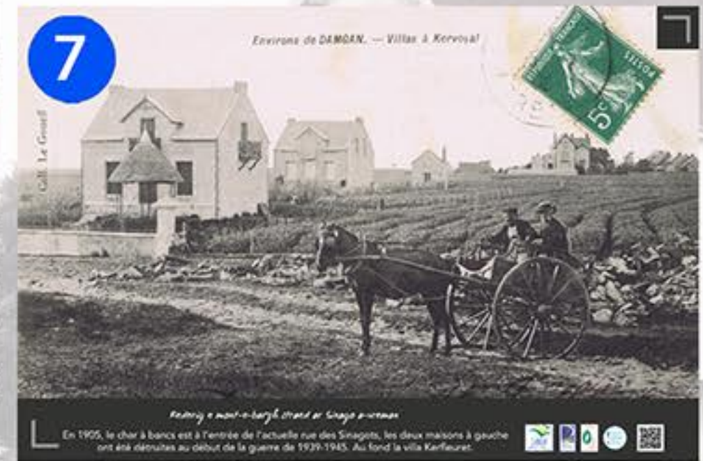
7 Environ de DAMGAN. - Villas à Kervoyal Le char à bancs est à l'entrée de l'actuelle rue des Sinagots, les deux maisons à gauche ont été détruites au début de la guerre de 1939-1945. Au fond la villa Kerfeuret.