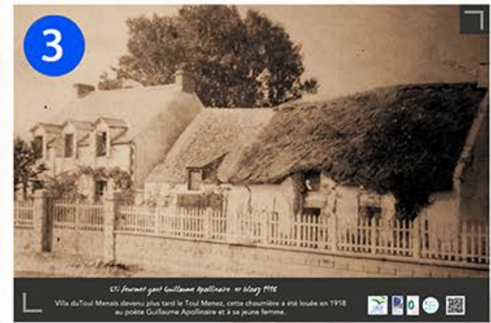
3 St. Jeannet pour Guillaume Apollinaire en 1918 Villa du Toul Menes devenu plus tard le Toul Menes, cette chaumière a été louée en 1918 au poète Guillaume Apollinaire et à sa jeune femme.