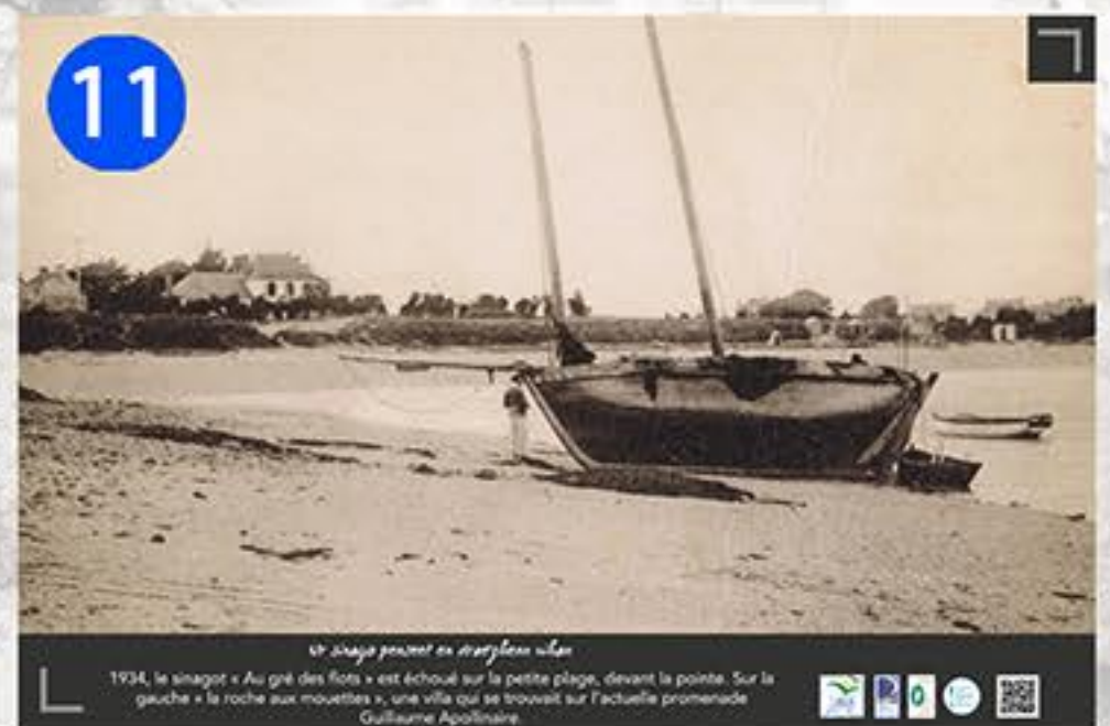
11 Le sinagot échoué sur la petite plage 1934, le sinagot « Au gré des flots » est échoué sur la petite plage, devant la pointe. Sur la gauche « la roche aux mouettes », une villa qui se trouvait sur l'actuelle promenade Guillaume Apollinaire.